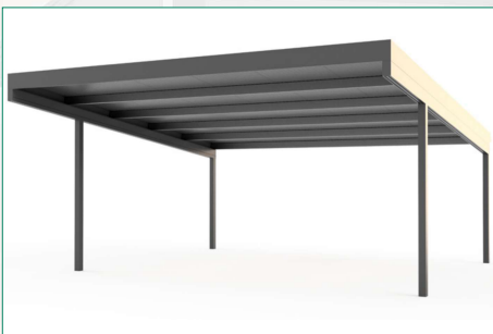
Doppelcarport 6 x 6 m