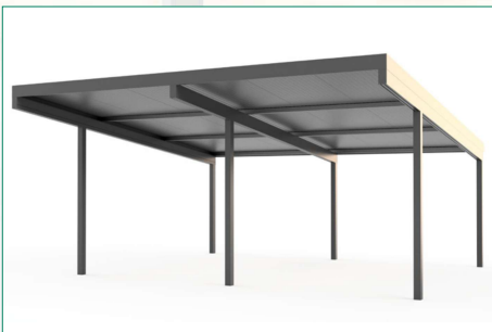
Doppelcarport 6 x 6 m mit Unterzug